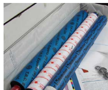
Три варианта накатного валика различных изготовителей

Машина, выбранная для испытаний, уже отпечатала 64 млн. оттисков, но по-прежнему находится в хорошем