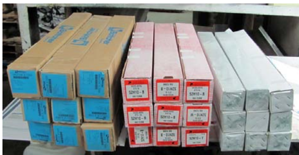
Комплекты валиков доставлены в типографию